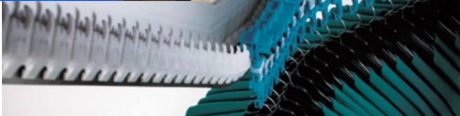
Retouren- analyse- systeme für Otto Ver- sand und Heinrich Heine