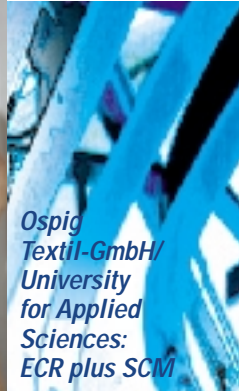
Ospig Textil-GmbH/ University for Applied Sciences: ECR plus SCM