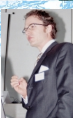
Einsatz- potenziale der Transponder- technologie in der Bekleidungs- industrie