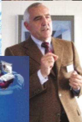
Tedeus AG Eventmanagement auf Basis von RFID: das EFC-Euro Fashion Center Sindelfingen