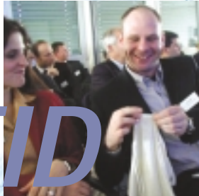
Transponder: Harte Fakten in zarter Wäsche